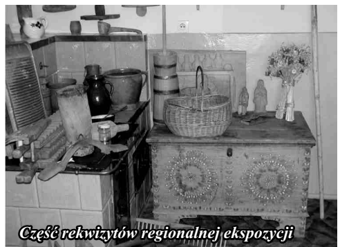
Część rekwiizytów regionalnej ekspozycji