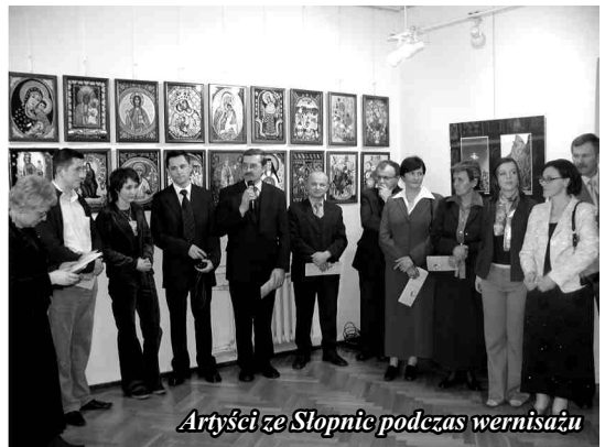
Artyści ze Słopnic podczas wernisażu

"Pomysł na produkt z siana zrodził się, aby wyjść na przeciwko oczekiwaniom, tych którzy chcą nabyć wyjątkową pamiątkę z pobytu w naszej miejscowości, a także tych którzy cenią rękodzieło i chcą posiadać coś