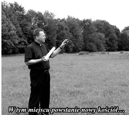
W tym miejscu powstanie nowy kościół...

- Sceptycy twierdzą, że decyzya o rozpoczęciu budowy