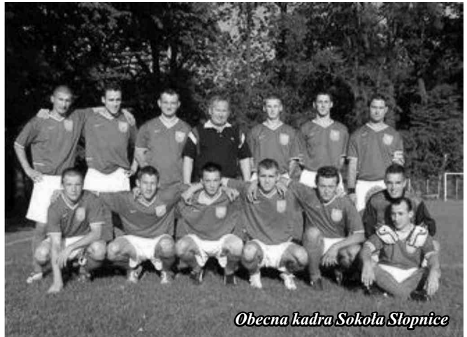
Obecna kadra Sokola Słopnice